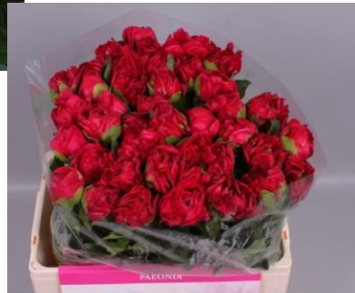
PAULA FAY 55/50 CM